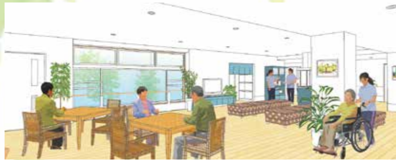
共同生活スペース

多目的に利用が可能なラウンジは、笑顔と賑わいの中心地。地域交流、イベント、講演など、幅広いご利用が可能です。