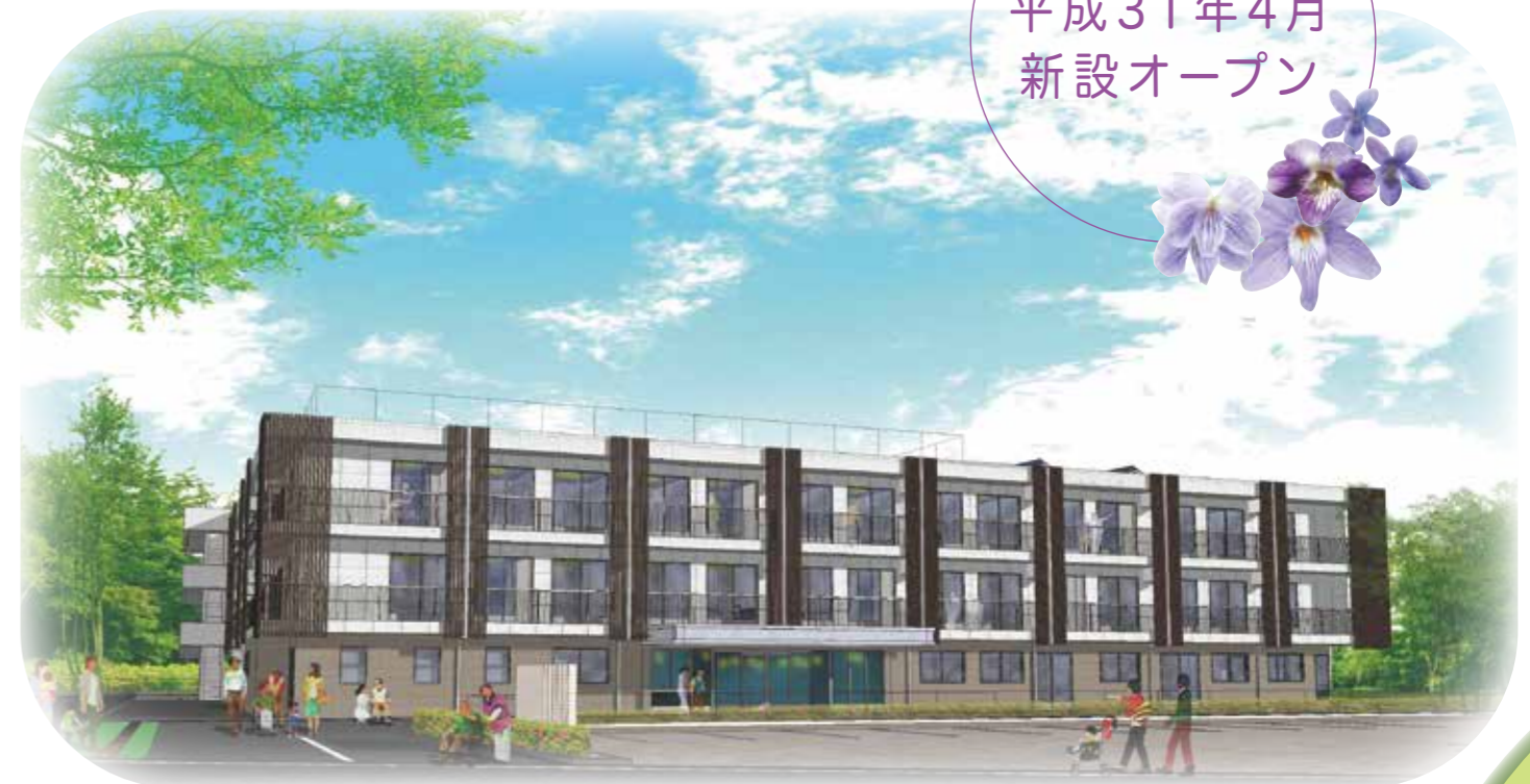
すみれ野完成予想図