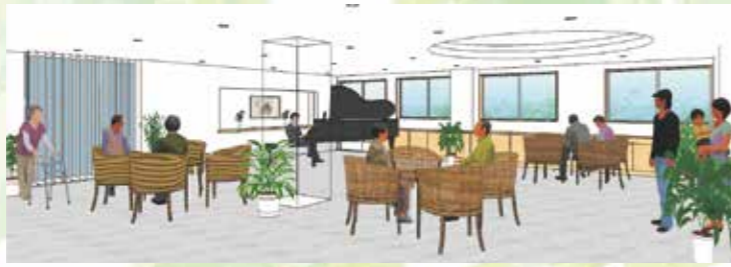
ラウンジ 地域支援スペース

緑豊かな中庭を設け、採光を重視しました。館内に足を踏み入ると、明るく広々としたホールがお出迎えます。